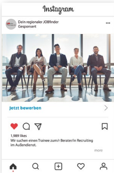
Beispiel: MRB-Technologie auf Instagram