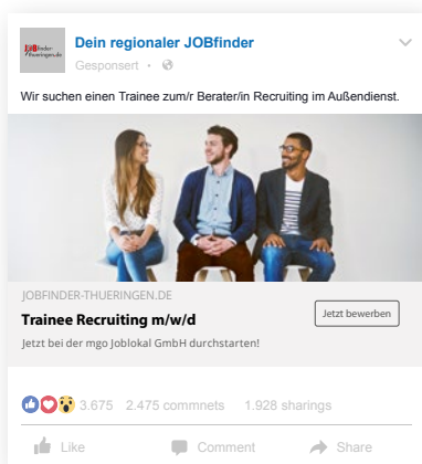
Beispiel: MRB-Technologie auf Facebook