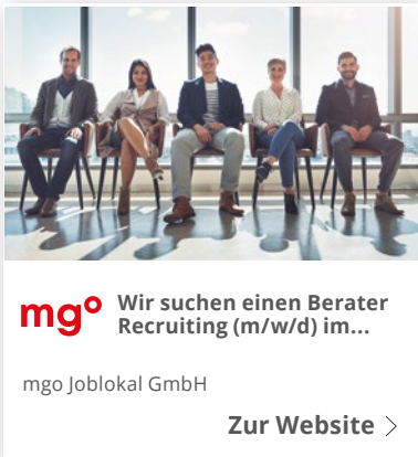
Beispiel: MRB-Technologie auf Google Display (stationär)