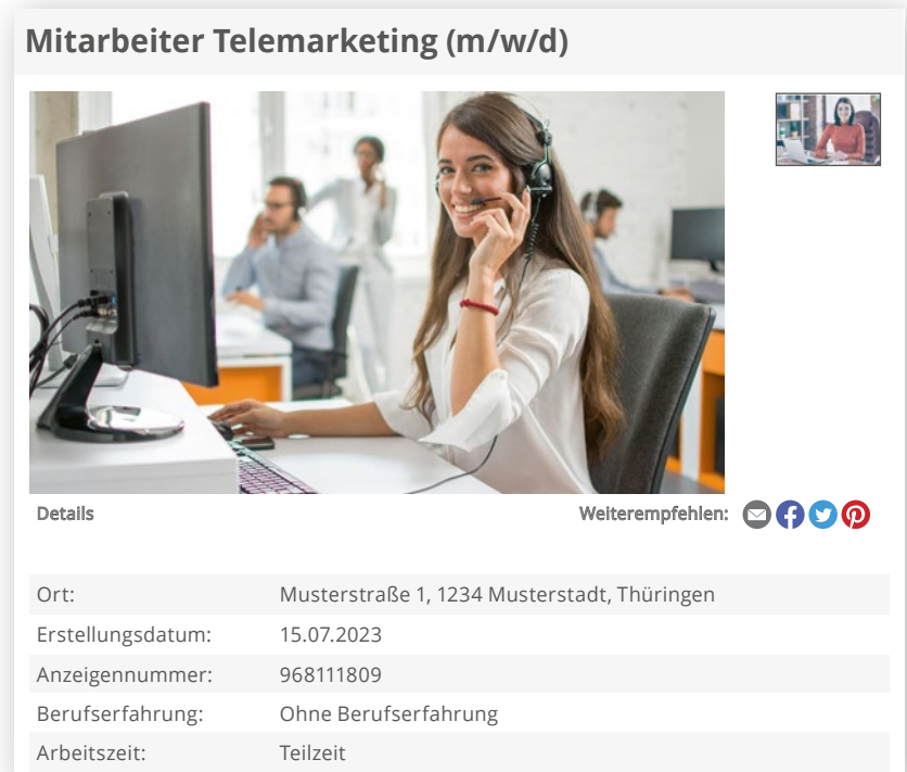
Beispiel: MRB-Technologie auf Kleinanzeigen