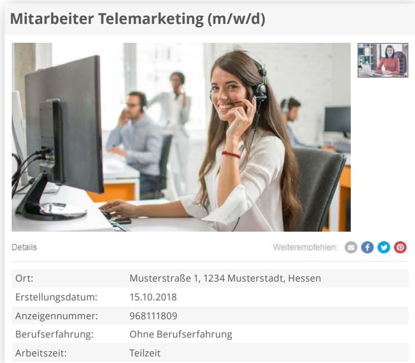
Beispiel: MRB-Technologie auf Ebay Kleinanzeigen

* Die MRB-Technologie ist nur in Kombination mit einer Stellenanzeige auf einem unserer regionalen Online-Stellenportale zu buchen. Der Preis beträgt pro MRB-Technologieanwendung und gewähltem Paket 250,- € zzgl. MwSt. Anmerkung: Es besteht keine Garantie für die Veröffentlichung der Stellenanzeige auf bestimmten Webseiten bzw. in bestimmten Apps. Die Ausspielung erfolgt performancebasiert durch die Joblokal Nordbayern GmbH. Die Umsetzung erfolgt innerhalb von 48h werktags. Die Laufzeit der Stellenanzeige auf einem unserer regionalen Online-Stellenportale beträgt 30 Tage. Die Laufzeit der MRB-Technologie beträgt 7 Tage.