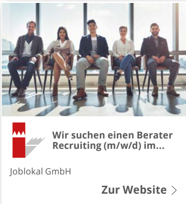
Beispiel: MRB-Technologie auf Google Display (stationär)