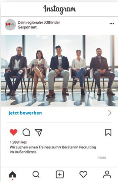
Beispiel: MRB-Technologie auf Instagram