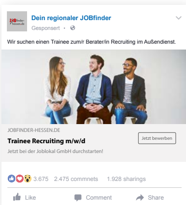
Beispiel: MRB-Technologie auf Facebook